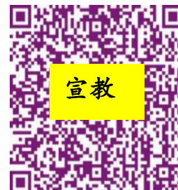
UEN: 201206026Z MIS Mission Fund