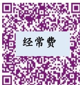
UEN: 201206026Z GEN General Fund