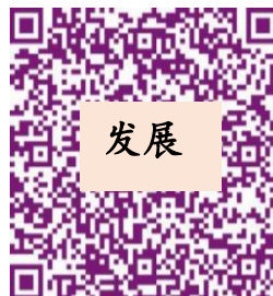
UEN: 201206026Z DEV Development Fund